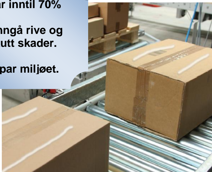
Antiskli Emballasjesikring er et miljøvennlig vannbasert lim